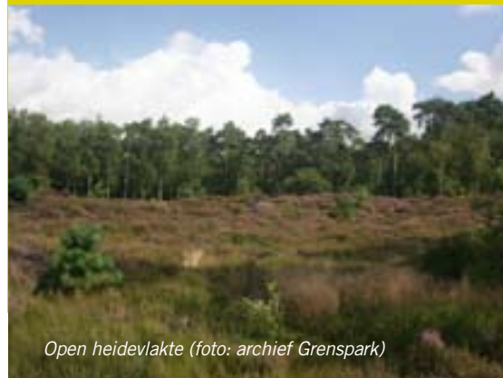
Open heidevlakte

3 Dit is de enige open heidevlakte die je tijdens je wandeling zal aantreffen. De struikhei is hier de dominante soort. Enkele berken en vliegdennen doorbreken de vlakte en zijn uitstekende rust- en uitzichtposten voor vogels. Op een zonnige zomerdag hoor en zie je hier wel eens een buizerd. Voorbij de heidevlakte tref je twee grassoorten aan in het bos. Het robuuste en struise pijpenstrootje (dat je ook op de heidevlakten in het Grenspark terugvindt) en de frêle bochtige smele, die met zijn zachte en losse aartjes de bosbodem omtovert tot een poëtische 'graszee'.