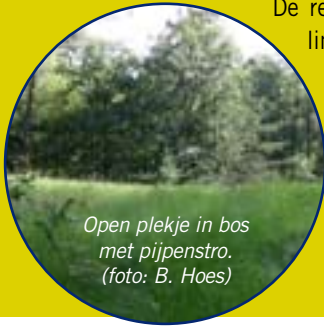
Open plekje in bos met pijpenstro.

voedsel. Het zijn vooral 'knabbelaars' die verzot zijn op jonge boomknoppen. Zo remmen ze een al te roekeloze bosvorming af en zorgen ze voor het voortbestaan van open plekken in het bos. Deze bossen zijn niet alleen een geliefd voedselterrein, ze vormen voor reeën ook een geschikte schuilplaats.