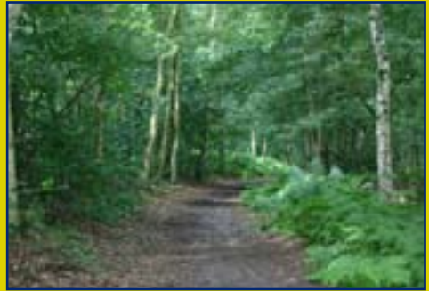
Wandelpad wandeling Vos

De rest van de wandeling loopt langs een kronkelig bospad. Met een beetje geluk ontmoet je één of meer reeën. Bij schemering gaan deze dieren op zoek naar