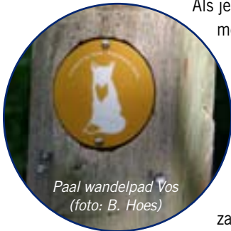
Paal wandelpad Vos

kan hier ook heel mooi de gelaagdheid van een ecologisch bos bekijken: moslaag, kruidlaag, struiklaag en kruinlaag. In een 'gelaagd' bos vind je meer planten- en diersoorten dan in een aangeplant 'rijtjesbos' en dus meer leven.